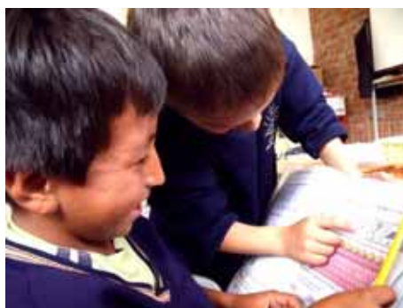
Der Schulunterricht endet im Juni und die Schülerinnen und Schüler wiederholen das während des Jahres Erlernte.

Während der dritten Woche im Juni wurden den Eltern die Zeugnisse ihrer Kinder mit den während des Jahres erreichten Resultaten übergeben.