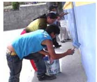
Väter und Mütter bessern das Äussere der Schulzimmer, wo ihre Kinder unterrichtet werden, aus.

ten und die grünen Bereiche schöner gestaltet. Die Schule sieht erfreulich aus und wirkt dadurch einladender.