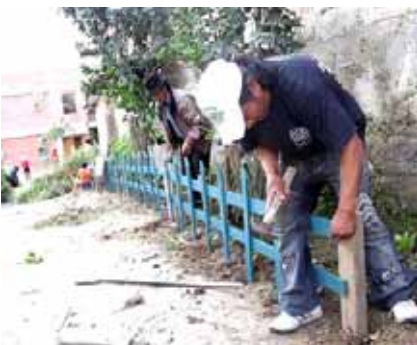
Eine Gruppe von Eltern wechselt die Einzäunung des Gartens aus.

Unter der Leitung der Präsidentin hat sich die Elternvereinigung mehrmals zusammengesetzt, um zu besprechen, wie die Schule, in der ihre Kin-