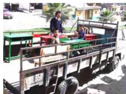
Schülerinnen und Schüler der Werkstatt können ihre selbst hergestellten Werke nach Hause mitnehmen.

Alle Schülerinnen und Schüler des ersten Zyklus konnten mit Stolz die