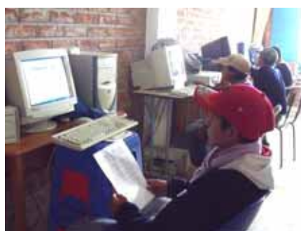
Nach Erledigung ihrer Aufgaben stellen sich die Schüler auf ihre wohlverdienten Ferien ein.

Daneben gab es eine besondere Feier für die Schülerinnen und Schüler, welche die sechs Jahre Primarschule abgeschlossen haben und für den Übertritt in die Sekundarschule bereit sind.